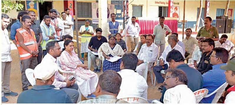
స్థానికులతో సమావేశమైన సిఎస్ కమిషనర్ సృజన

-జగద్గురులలో కమిషనర్ సృజన క్షేత్రస్థాయి పర్యటన -కాలనీవాసులతో మాటామంతి... స్థానిక సమస్యలపై చర్చ