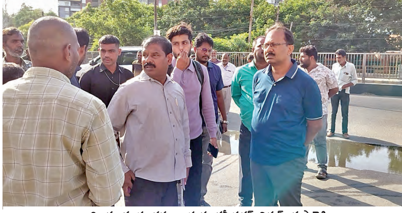
అధికారులకు సూచనలు ఇస్తున్న కమిషనర్ వినయ్ కృష్ణారెడ్డి

-ట్రాఫిక్ కు అంతరాయం కలిగించే వారిపై కఠిన చర్యలు : కమిషనర్ వినయ్ కృష్ణారెడ్డి