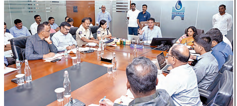
హైద్రా-సిఎస్ సమావేశంలో మాట్లాడుతున్న కమిషనర్ రంగనాథ్, సిఎస్ కమిషనర్ సృజన తదితరులు

-15రోజులలో సమస్యలు పరిష్కారానికి ప్రణాళిక -అన్ని శాఖలు సమన్వయంతో పనిచేయాలి - హైద్రా కమిషనర్ రంగనాథ్